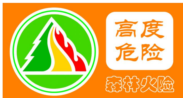
图3 森林火险橙色预警信号标识

(五) 森林火险红色预警信号表示：未来一天至数天预警区域森林火险等级为五级，林内可燃物极易点燃，极易迅猛蔓延，扑火难度极大，极度危险。预警信号标识的底色和文字采用红色，表示危险程度的文字为：极度危险。