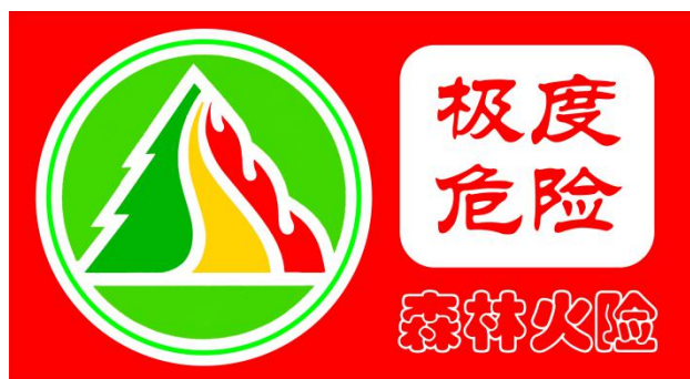
图4 森林火险红色预警信号标识

(五) 森林火险红色预警信号表示：未来一天至数天预警区域森林火险等级为五级，林内可燃物极易点燃，极易迅猛蔓延，扑火难度极大，极度危险。预警信号标识的底色和文字采用红色，表示危险程度的文字为：极度危险。