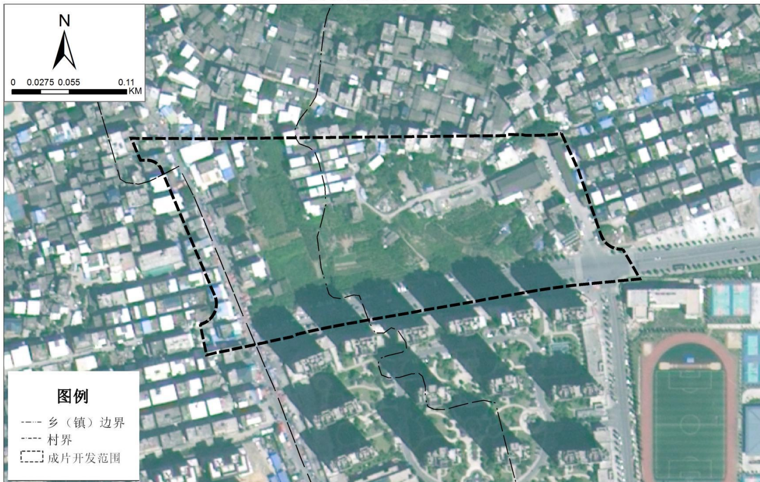
成片开发位置示意图