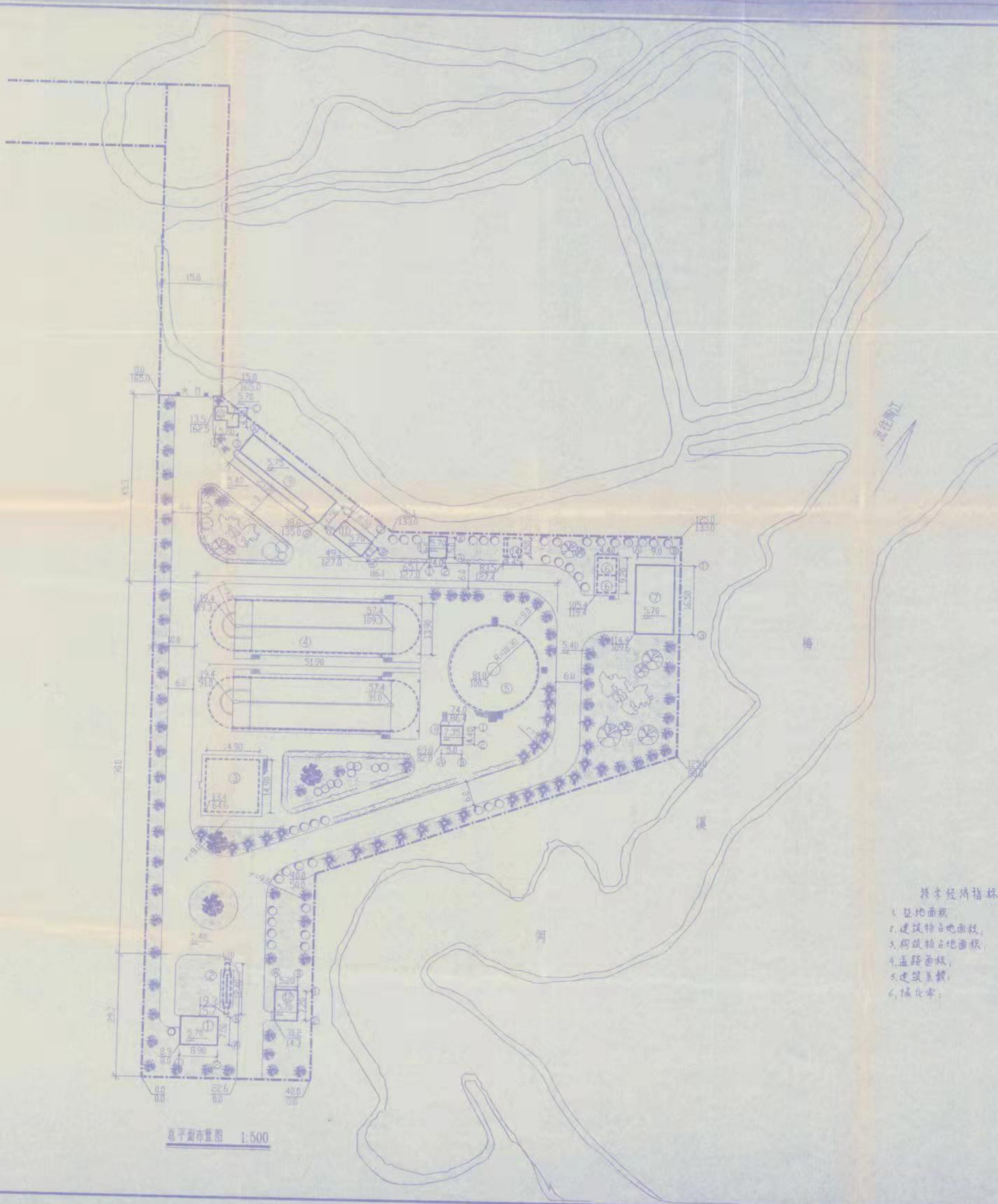
主要构筑物一览表